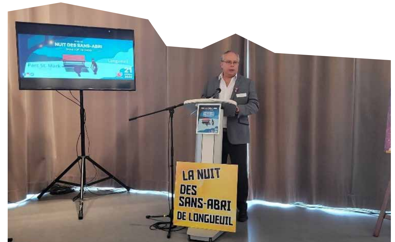
Conférence de presse – octobre 2022 Nuit des sans-abri de Longueuil

En 2022-2023, la permanence de la TIRS a fait l'objet d'une quinzaine d'activités médiatiques sous forme d'entrevues, de communiqués de presse, d'articles de journaux et de reportages. Les principaux thèmes abordés étaient l'itinérance à Longueuil, le débordement des ressources et la Nuit des sans-abri de Longueuil 2022. Nous souhaitons avoir plus de visibilité dans l'espace public en 2023-2024.