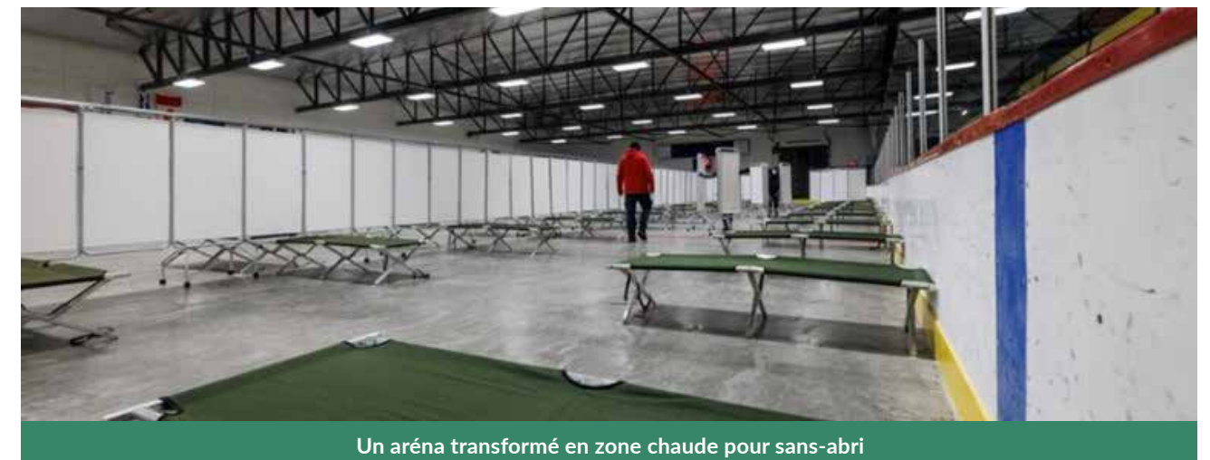
Un aréna transformé en zone chaude pour sans-abri