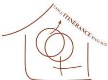
Table Itinérance Rive-Sud