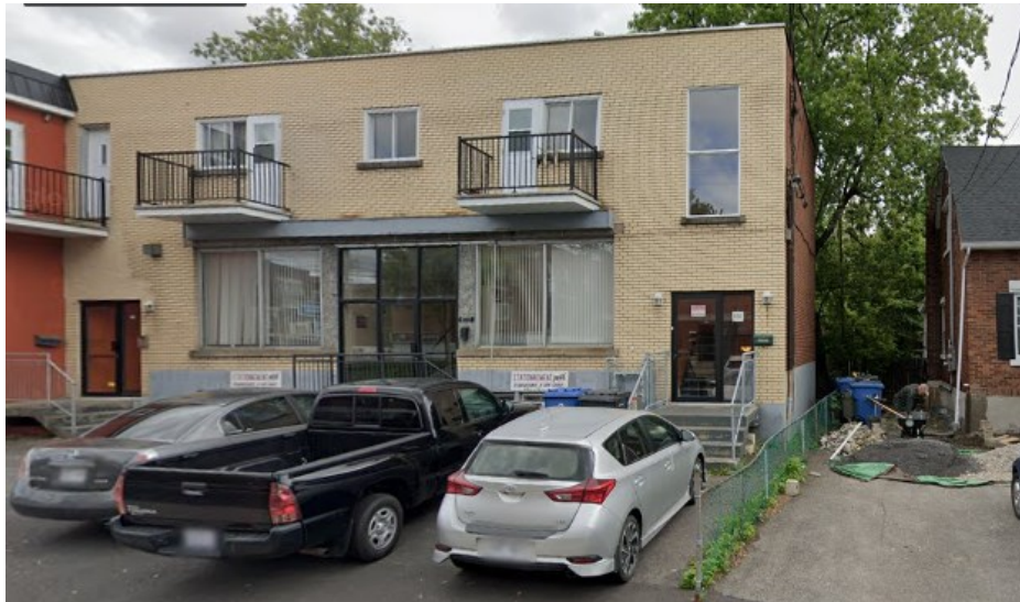
Table Itinérance Rive-Sud 450 646-7809 poste 4 / 438-504-5202 www.tirs.ca

Perspectives de déménagement en juin 2020 au 670 rue St-Jean, Longueuil