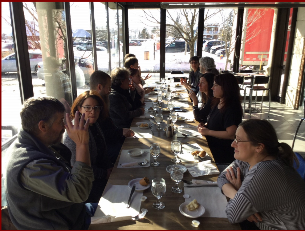
Les responsables de neuf projets régionales SRA participent à une rencontre d'échange organisée à Drummondville en janvier 2018

Le projet intégré poursuit son développement et nous avons obtenu des résultats positifs cette année.