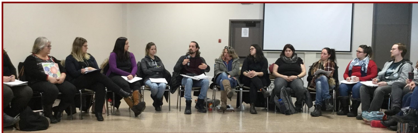
Rencontre Interaction à Brossard. Une trentaine d'intervenants du milieu communautaire et institutionnel échangent sur les limites en intervention.

Cette année, plus de 60 personnes ont participé aux trois rencontres Interaction qui, grâce à la collaboration de membres et de partenaires, se sont déroulées à Saint-Lambert, Brossard et Saint-Bruno.