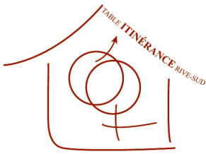
TABLE ITINÉRANCE RIVE-SUD (TIRS)