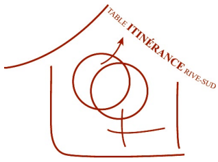
TABLE ITINÉRANCE RIVE-SUD